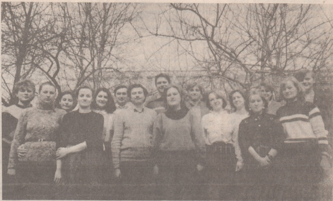
НА СНИМКЕ: студенты первой группы 4 курса исторического факультета.