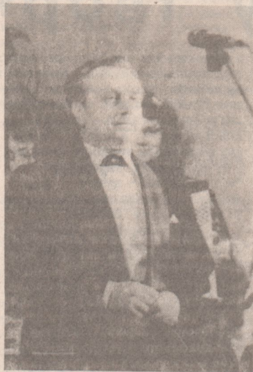
На фотографиях — фрагменты выступлений самодеятельных артистов Гродненского госуниверситета на концерте «Студенческая весна-87».