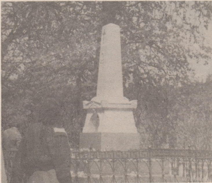
У Могилы Александра Сергеевича Пушкина.