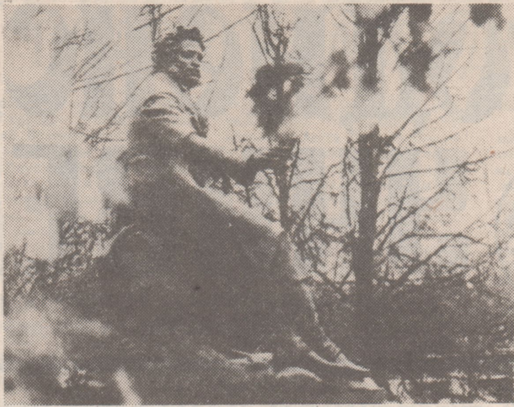
Памятник А. С. Пушкину в Пушкинских горах.