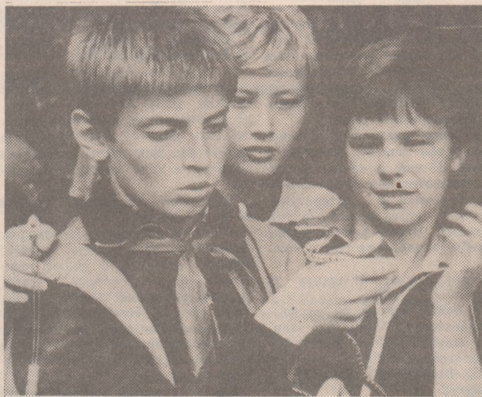
Встреча с «лесным братом».

Мы сидим со старшей вожатой на скамеечке, а рядом любопытное сооружение из нескольких бревен, сложенных кругом. В центре — кострище. Оказалось, что это так называемое «отрядное место». Их несколько прямо на территории лагеря. Здесь у небольшого костра отряд собирается вполне неофициально, посидеть, поговорить, сварить ухи. Оказывается, такие «вольности» вполне уживаются с необходимым режимом и порядком. Даже, пожалуй так: порядок не вопреки «вольностям», а скорее благодаря им. Ведь и маленькие дети способны оценить доверие старших. А отрядам здесь предоставлена большая самостоятельность.