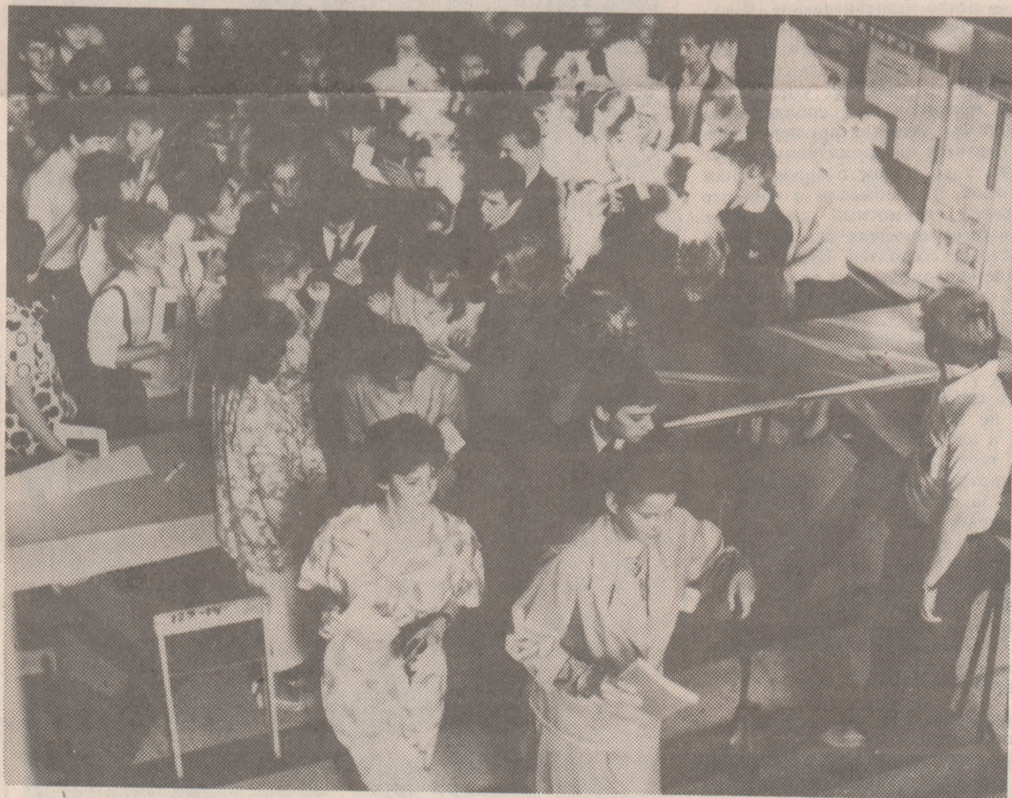
Кто-нибудь из первокурсников наверняка узнает себя среди абитуриентов этого года.