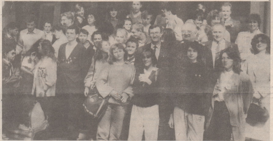
Фото на память. Лиможцы с комсомольцами и сотрудниками нашего университета.