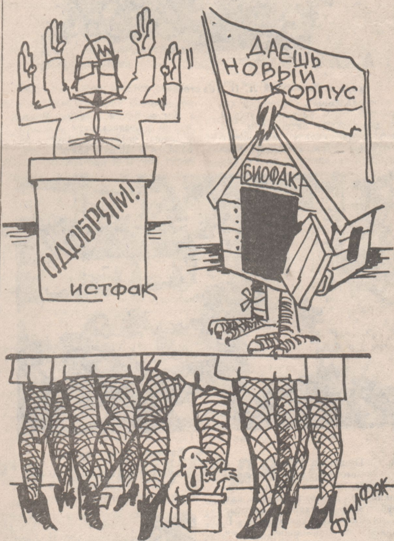
Рис. Д. ОБРАЗЦОВА.