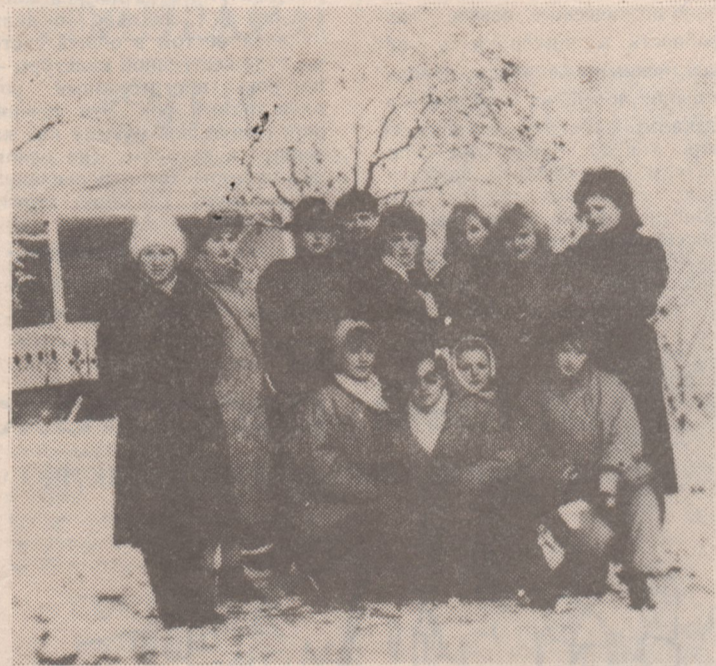
У входа в Дом-музей Л. Н. Толстого

В своем завещании Лев Николаевич запретил ставить памятник на своей могиле. Но в Туле стоит памятник великому писателю. Это особый памятник. Нет привычного высокого постамент, возносящего скульптуру над нами. Высота постамент всего около полуметра,