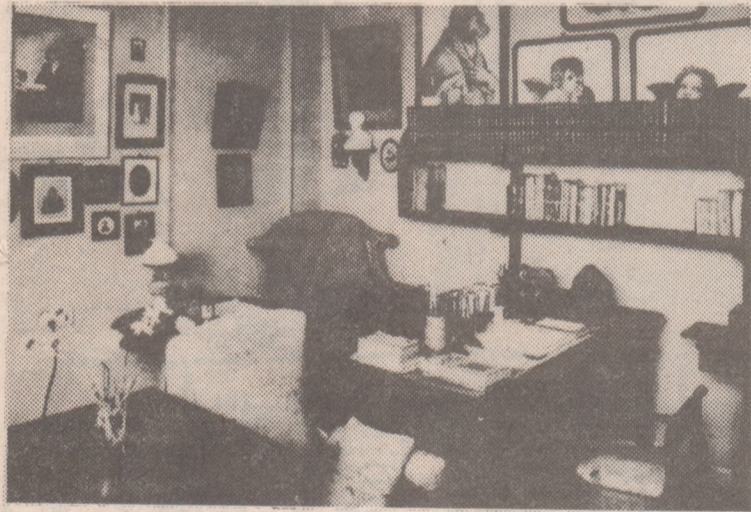
Кабинет Л. Н. Толстого

родного. Вот и Ясная Поляна. Место жизни и деятельности великого русского писателя. Здесь он родился и провел почти шестьдесят лет. В Ясной Поляне бы-