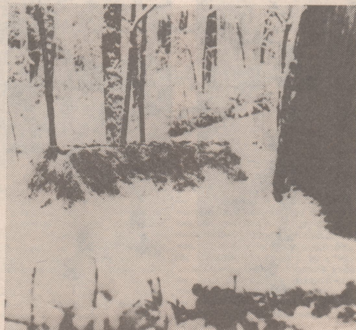
Могила Л. Н. Толстого

поэтому кажется, что это всего лишь немного приподнятый пласт почвы. А на нем гигантская фигура с развевающейся бородой, с посохом в руке.