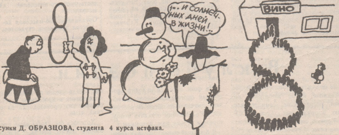
Рисунки Д. ОБРАЗЦОВА, студента 4 курса истфака.