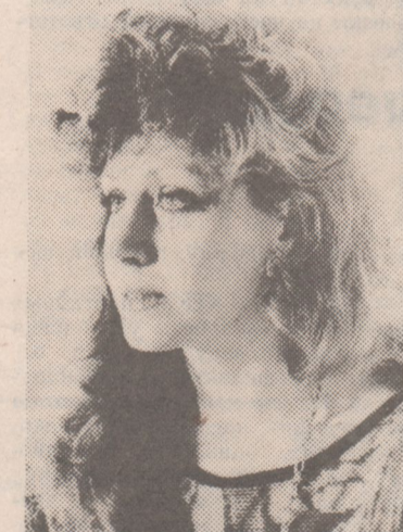
Подборку материалов «С Днем 8 Марта, с праздником весны!» подготовила Л. МАНЦЕВИЧ.

— А еще — постоянного довольства собой. Женщине нужно руководствоваться принципом: не хуже всех, и лучше многих. Это позволит в самую трудную минуту оставаться оптимисткой, верить в свои силы.