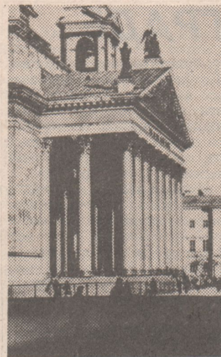
НА СНИМКЕ: Исаакиевский собор.