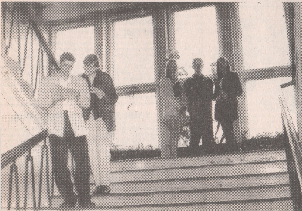
Праз хвілінку - уступны экзамен.

Л. ЯРУНЦАВА, супрацоўнік аддзела замежных сувязяў, маркетынгу і права.