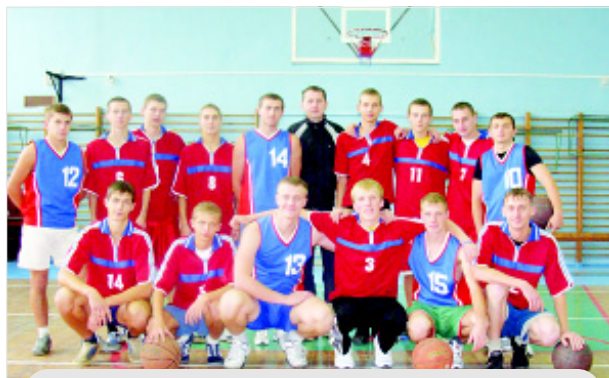
Участники товарищеской встречи по баскетболу между учащимися и выпускниками, посвящённая 70-летию колледжа