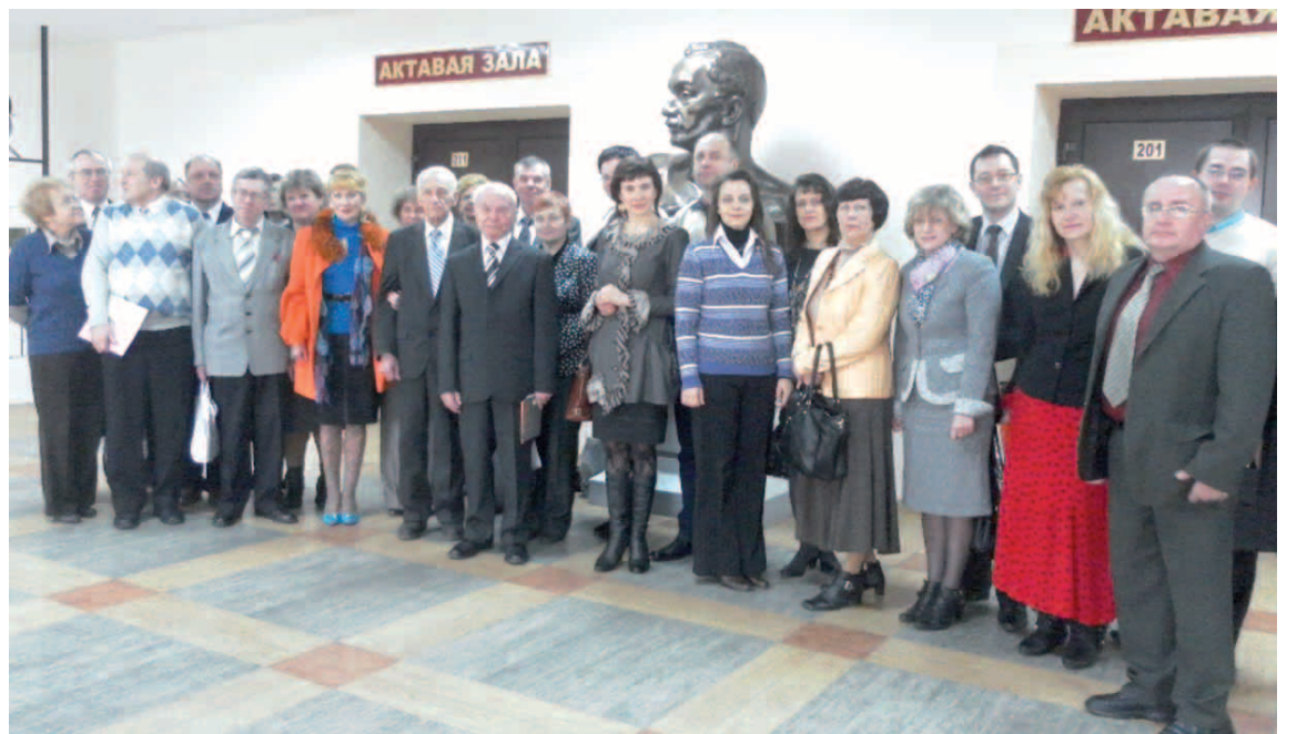
Удзельнікі Купалаўскіх чытанняў у ГрДУ імя Янкі Купалы

У дакладах удзельнікаў форуму былі разгледжаны пытанні: роля Янкі Купалы ў беларускай літаратуры і культуры, Янка Купала і актуальныя праблемы мовазнаўства, актуальныя праблемы купалазнаўства ў вышэйшай і сярэдняй шко-