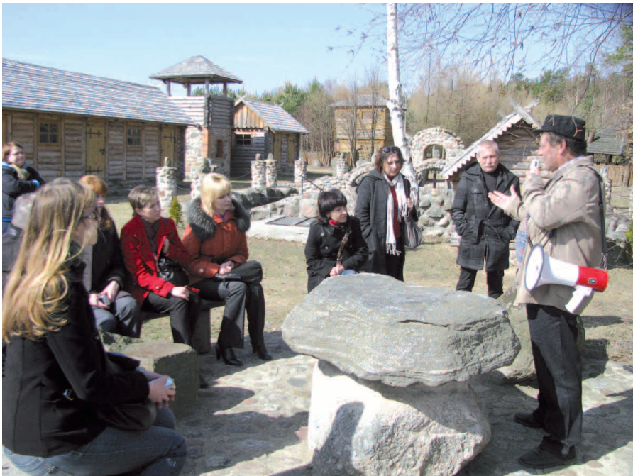
Участники тренингов в музее «Осада Яцвезско Прусская»

образовательных и туристско-прикладных мероприятий.