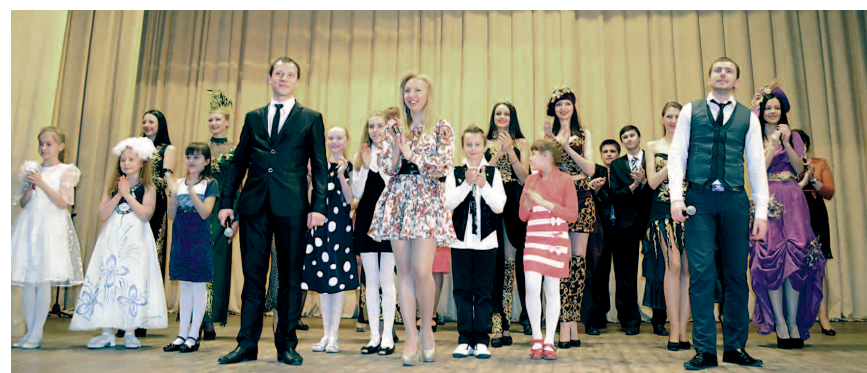
Выступленне ўдзельнікаў імпрэзы, прысвечанай М. Танку