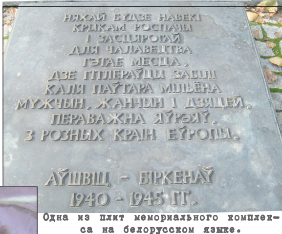
Одна из плит мемориального комплекса на белорусском языке.

протяжении долгих дней. Поэтому часто люди умирали медленно, мучительно. Иногда по несколько часов... Когда в газовой камере наступала тишина, каратели включали вентиляцию. И специально отобранные узники лагеря переносили тела умерших в крематорий, где их души черным столбом дыма устремлялись в небо.