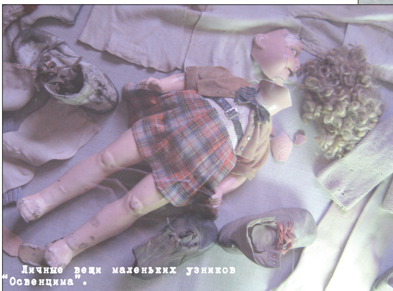
Личные вещи маленьких узников «Освенцима».