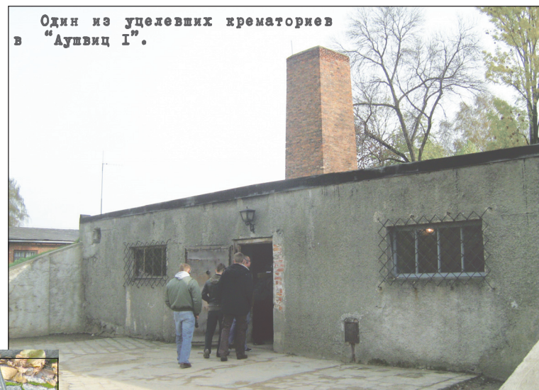
Один из уцелевших крематориев в «Аушвиц I».

Все раздевались, оставляли вещи в сортировочной комнате и входили в душевую, которая в действительности оказывалась газовой камерой. Когда за спинами людей закрывались двери, начинался настоящий ад. В специально оборудованные люки засыпали белые гранулы, пропитанные ядовитым газом «Циклон Б». При правильно подобранной дозировке он вызывал мгновенную смерть. Но этого результата эсэсовцы добивались на