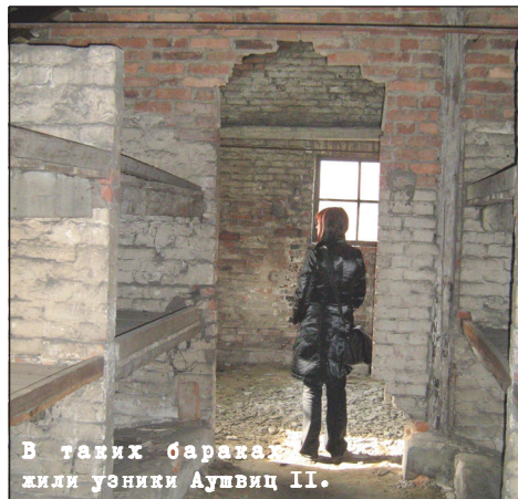
В таких бараках жили узники Аушвиц II.

По данным экспертных подсчетов, примерно десятую часть персонала концлагерей составляли женщины. Многие из них добровольно устраивались на подобную службу, причем не только в медицинскую либо хозяйственную части, но и в охранную структуру. Одной из таких печально известных надзирательниц стала Ирма Грезе. В 1943-1945 годах она занимала должность старшего надзирателя женского отделения лагеря. В свои двадцать с неболь-