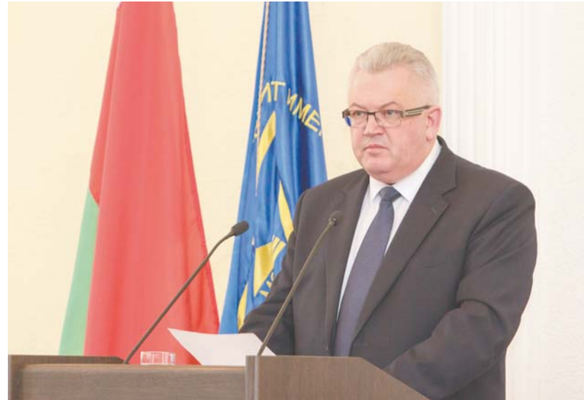
Министр образования Республики Беларусь Игорь Карпенко.

– От эффективности нашей совместной работы зависит будущее страны! – подытожил ректор.