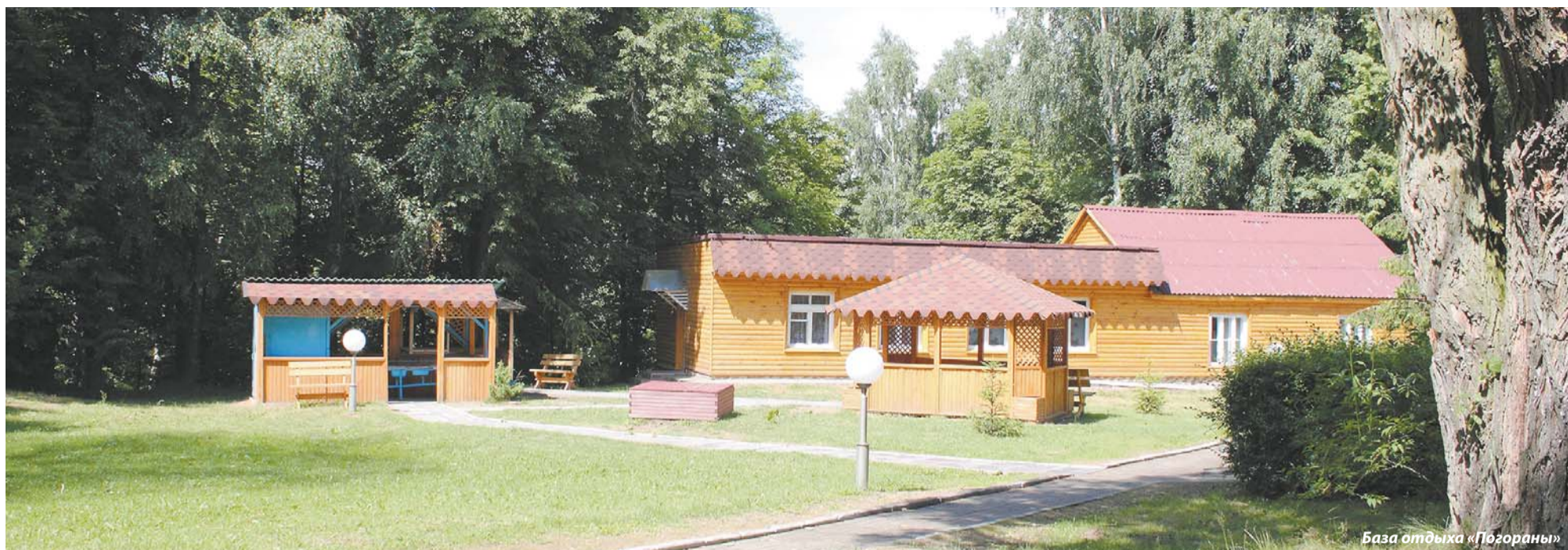
База отдыха «Погораны»