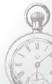
График работы: пн – пт: 08:00 – 19:00 без обеда Выходные: суббота, воскресенье

Запись по телефону: +375 (152) 48-13-84 Адрес: ул. Гаспадарчая, 23 (учебный корпус факультета экономики и управления)