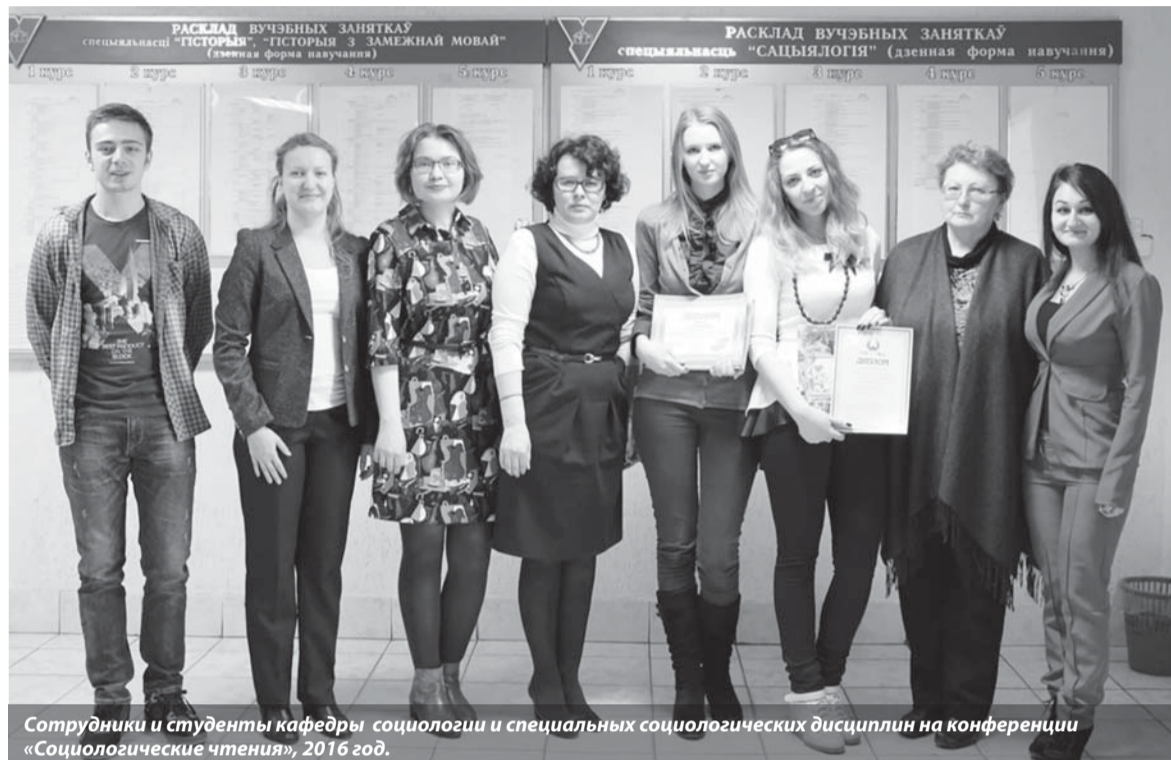
Сотрудники и студенты кафедры социологии и специальных социологических дисциплин на конференции «Социологические чтения», 2016 год.