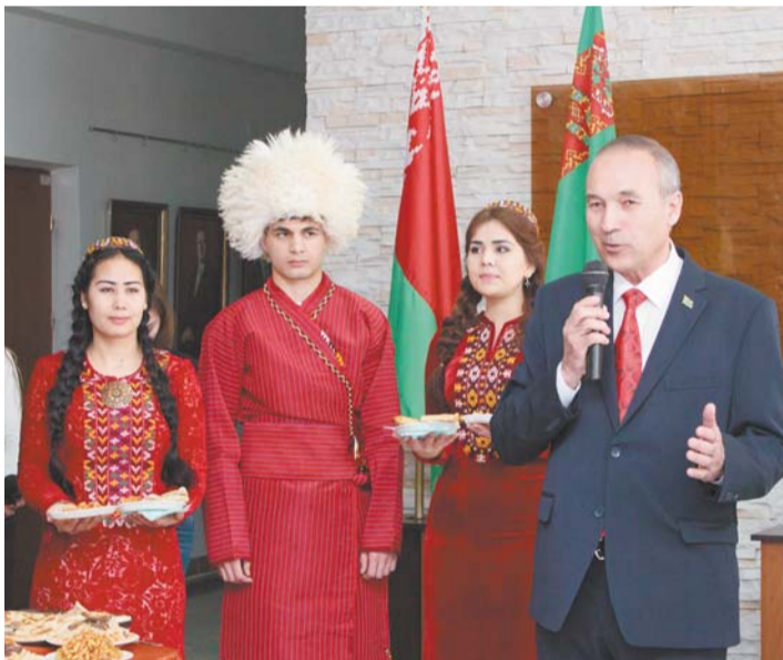
Чрезвычайный и Полномочный Посол Туркменистана в Республике Беларусь Назаргулы Шагулыев.

Впервые в купаловском университете прошел Открытый фестиваль туркменской культуры «Новруз Байрам». Праздник объединил иностранных студентов из гродненских и минских вузов.