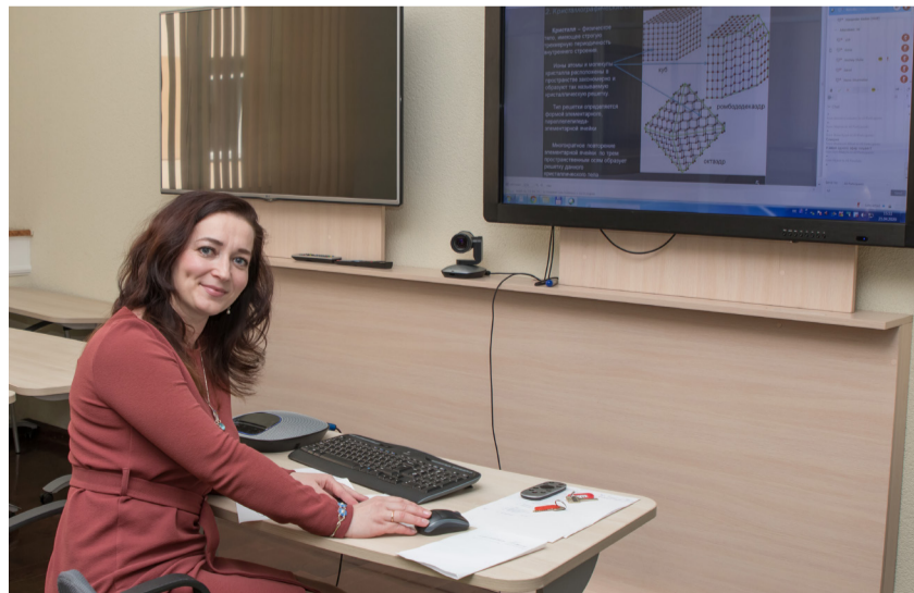
Матэрыялы паласы падрыхтавала Таццяна СУШКО .

Як расказала выкладчык кафедры журналістыкі Кацярына Касцюшка , у межах навучальных семінараў для выкладчыкаў арганізатары – вучэбна-метадычнае ўпраўленне – падрабязна, паэтапна дэманструюць алгарытмы працы з элементамі курса і, што вельмі важна, паказваюць, як бачаць элементы курса не толькі выкладчыкі, але і студэнты. Зручна, што навучанне праходзіць у рэжыме рэальнага часу – усё ўдзельнікі семінара могуць задаваць пытанні спецыялістам і аператыўна атрымліваць адказы. Яшчэ адзін важны момант – гэта магчымасць адначасова ўдасканаліць навыкі работы не толькі з адукацыйным парталам, але і з платформай Webex, на якой праходзіць семінар.