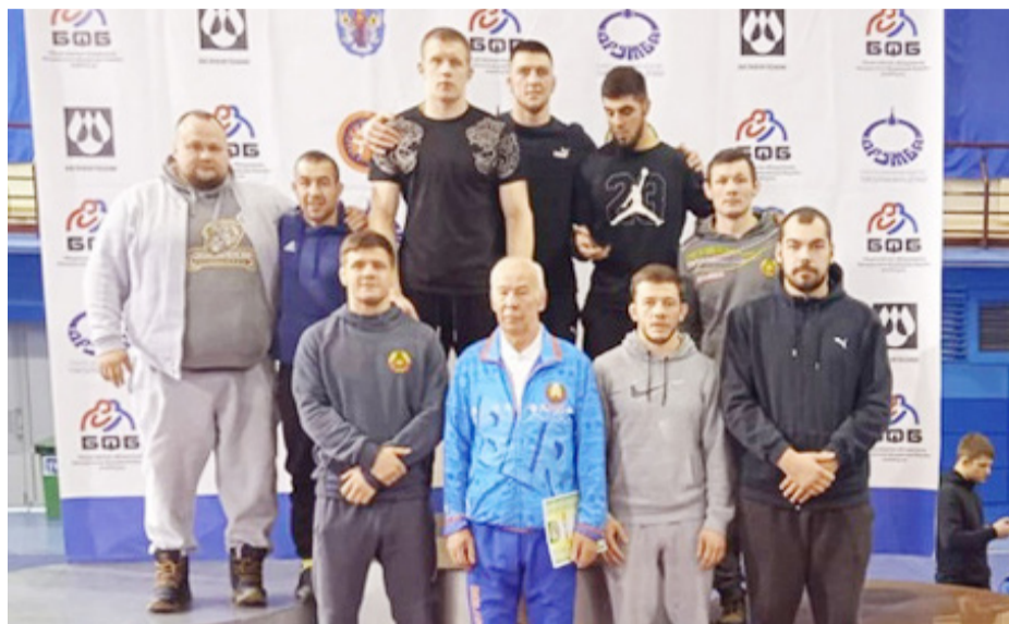
Студенты ГрГУ имени Янки Купалы – в числе победителей и призеров Чемпионата Республики Беларусь по греко-римской борьбе.