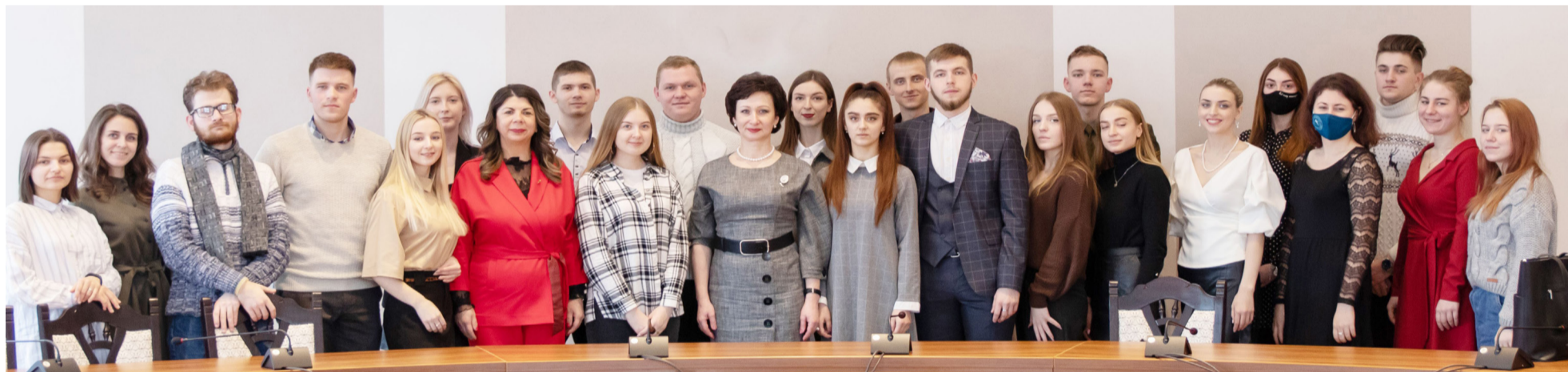
Представители студенческого актива ГрГУ имени Янки Купалы поделились своими впечатлениями от Всебелорусского народного собрания: