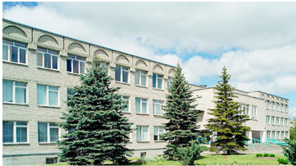
Волковысский колледж УО «Гродненский государственный университет имени Янки Купалы»