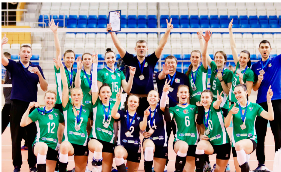
Команда Купаловского университета «Коммунальник-ГрГУ» завоевала серебро в финале женского Кубка Республики Беларусь по волейболу. По итогу серии матчей купаловцы уступили команде из Минска со счетом 2:3.