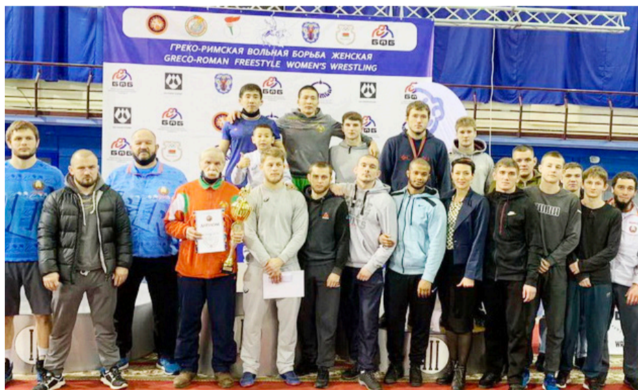
В копилке наград купаловцев – золотая, серебряная и бронзовые медали чемпионата Республики Беларусь по вольной борьбе.

▶ Купаловцам вручены сертификаты о прохождении обучения в Школе командиров и комиссаров студенческих отрядов