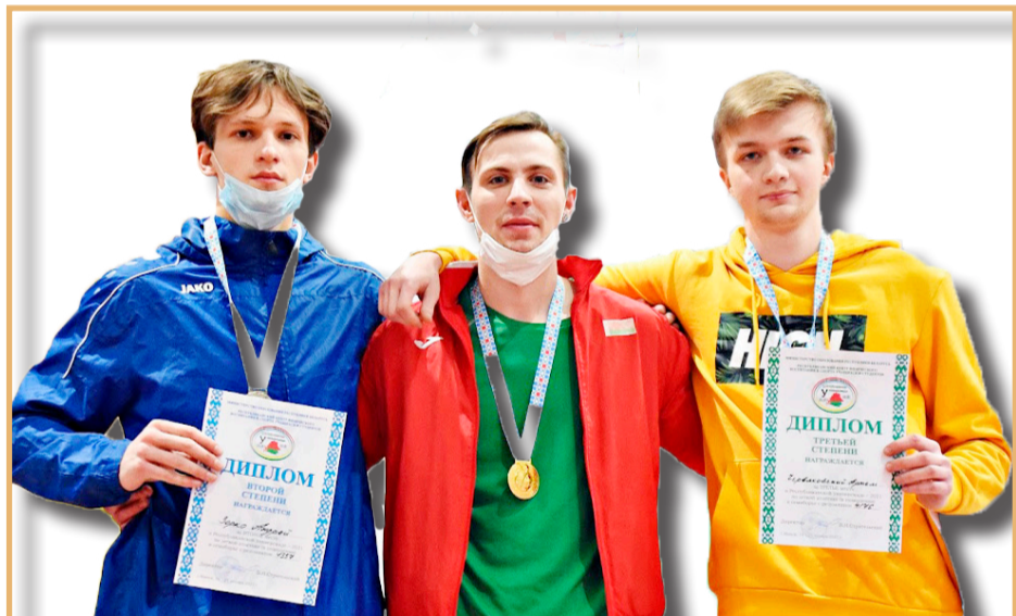
Представители ГрГУ имени Янки Купалы выступили на первых соревнованиях Республиканской универсиады-2021 по легкой атлетике. Сборная Купаловского университета заняла четвертое общекомандное место.