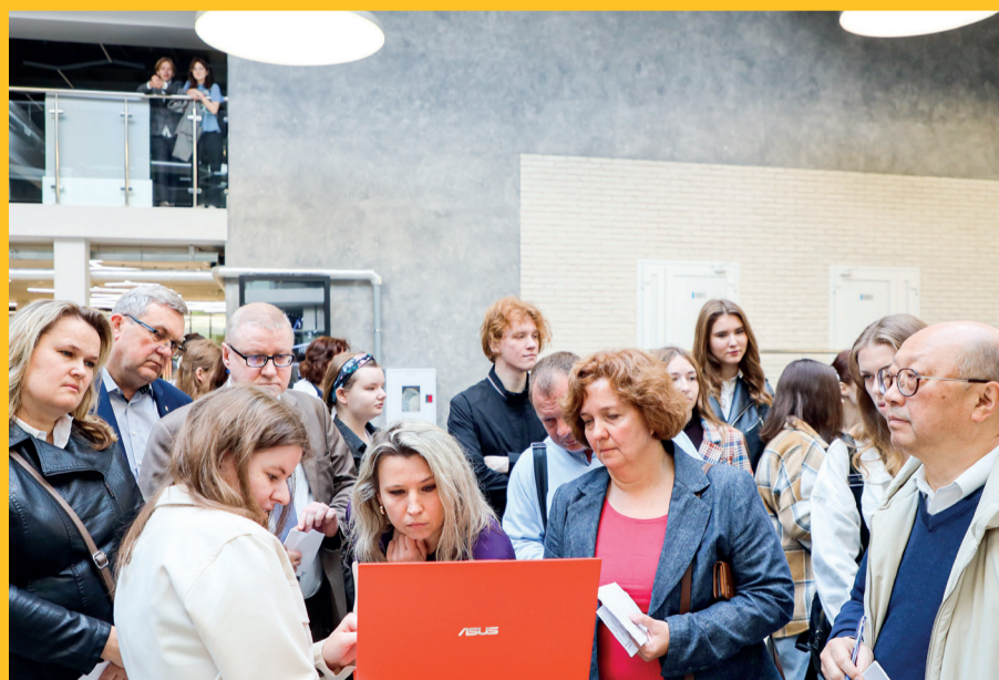
I Форум инноваций «ИнноФест», который проходил на базе технопарка