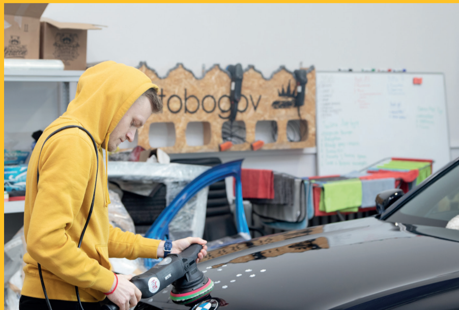
Компания «AutoVogov», которая реализует проекты по 3D-моделированию кузовных запчастей